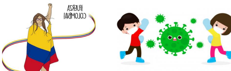
Ilustración 1 La gente lucha contra el coronavirus- FuerzaColombia: hacen ilustraciones en apoyo a Colombia – Noticieros

Televisanoticieros.televisa.com, adaptó Celene Gallego Castrillón 2021